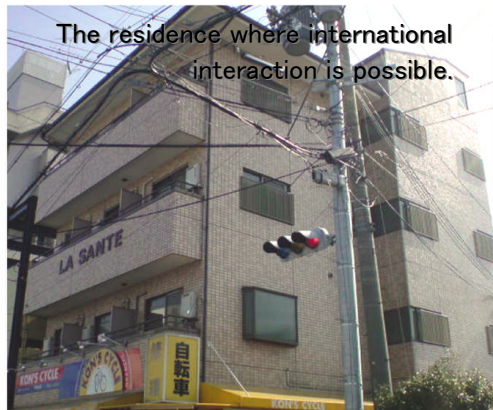
The residence where international interaction is possible.