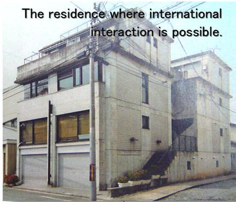
The residence where international interaction is possible.