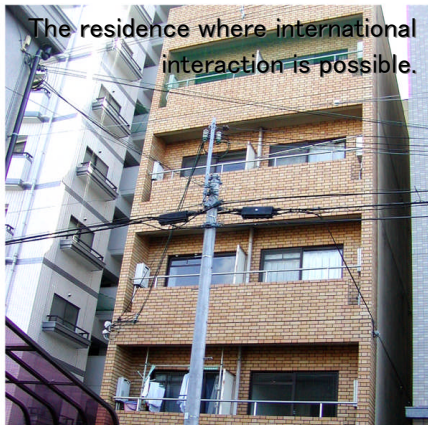
The residence where international interaction is possible.